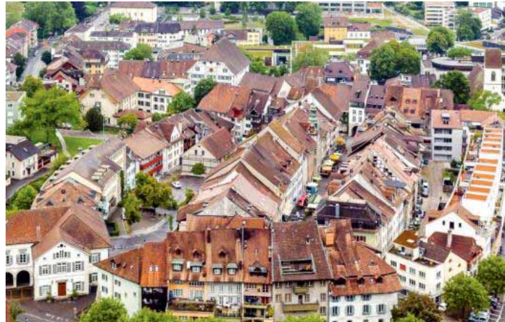
Altstadt in Lenzburg

Anmeldung und Bezahlung für die Landfrauenreise an Ihre Ortsvertreterin.