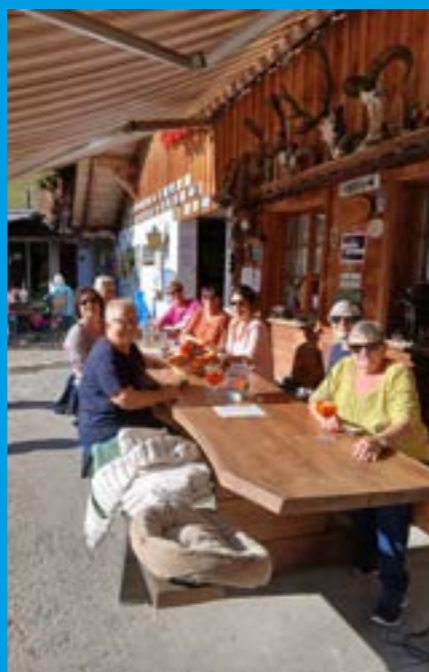
Ein herrlicher sonniger Ausflüglirast in den Wellnessstagen in Sigriswil 2025