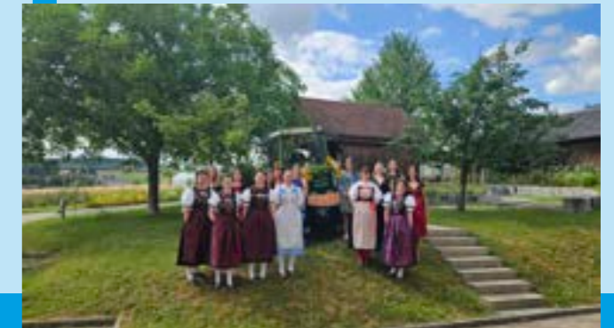
Abschluss der Klasse Fav25