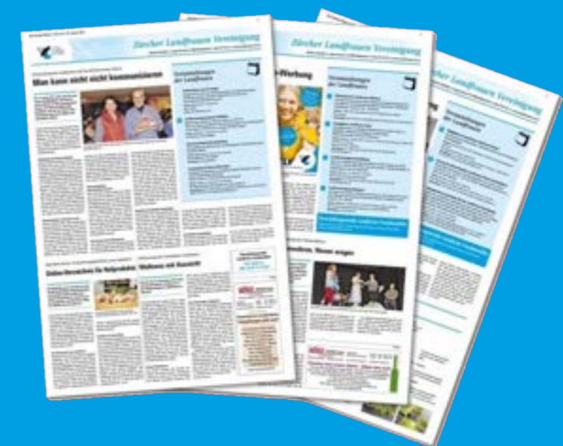
Die Landfrauenseite: Ein bunter Themenmix